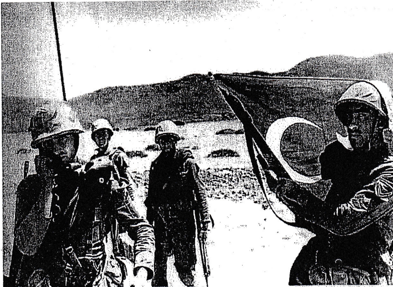
20 Ιουλίου 1974, Κυρήνεια. "Επιτέλους, πού είναι οι Έλληνες;" αναρωτιούνται οι Τούρκοι φαντάροι πριν αναχωρήσουν για τη Μερσίνα προκειμένου να παραλάβουν το δεύτερο αποβατικό σώμα. Εν τω μεταξύ, φωτογραφίζονται με την τουρκική σημαία.

22/11/2002), με την πρόσθεση νέων συμμάχων (Εσθονία, Λιθουανία, Λετονία, Σλοβενία, Σλοβακία, Ρουμανία, Βουλγαρία). Επιβεβαιώνονται για ακόμη μια φορά οι αρχικές δηλώσεις του διαβόητου δολοφόνου Μπους και της κλίμακας του ("όποιος δεν είναι μαζί μας, είναι εχθρός μας"), αλλά και οι προθέσεις των απαιταχού εξουσιαστών να εξασφαλίζουν τη συμμετοχή ολοένα και περισσότερων κρατών στις στρατιωτικές επιδρομές παγκόσμιας εμβέλειας, διατηρώντας σημείο επαφής μεταξύ ΗΠΑ - Ευρώπης - Ρωσίας, όπου θα συζητάσσονται η βιομηχανία όπλων και οι νέες τεχνολογίες.